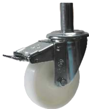
4 ruote ø 10 cm con sistema frenante

Tutti i modelli sono disponibili con e senza ruote.